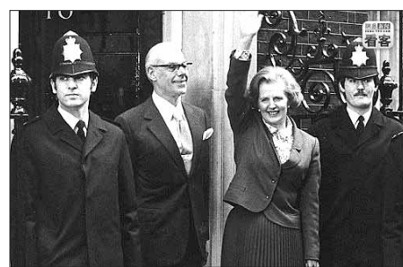
撒切尔夫人和丹尼斯·撒切尔的合影

上世纪50年代的英国很保守，撒切尔夫人出身常遭人嘲笑。同时，议员收入微薄，从政又需要大量金钱。在自传《唐宁街