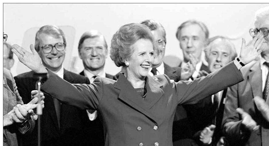
撒切尔夫人和丹尼斯·撒切尔的合影