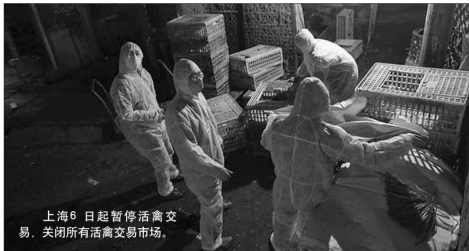
上海6日起暂停活禽交易,关闭所有活禽交易市场。

南京4月6日下午14时召开H7N9禽流感疫情防控工作新闻发布会。发布会上南京政府宣布,即日起暂停紫金山、天印山、建邺家禽批发市场活禽交易,对场内活禽实行不出不进。关闭涉疫情的江宁东新南路农贸市场活禽交易区。加强农贸市场活禽交易监管。