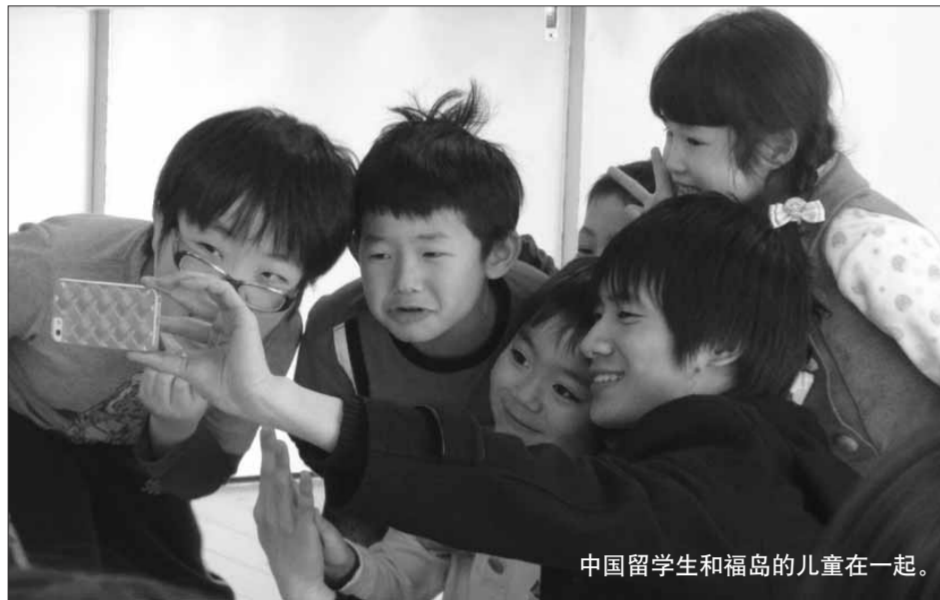
中国留学生和福岛的儿童在一起。