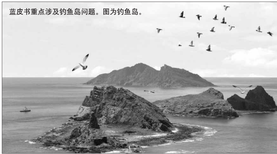
蓝皮书重点涉及钓鱼岛问题。图为钓鱼岛。

关于中国主张拥有主权的尖阁诸岛(中国称钓鱼岛)问题，蓝皮书指出“不存在需解决的领土主权问题”，并称中国进入日本领海、进行雷达照射是“对领土、领海和领空的威胁”。