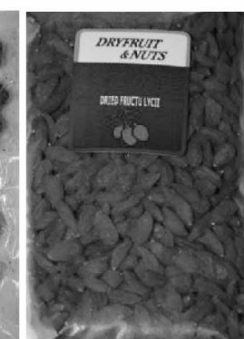
丸成 枸杞子 ¥420/200g