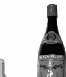
宇塔 5年花彫紹興酒 ¥698/640ml