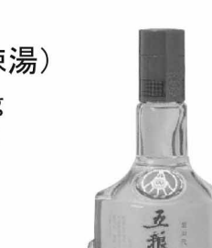
日和 五糧醇(瓶) ¥3,500/500ml