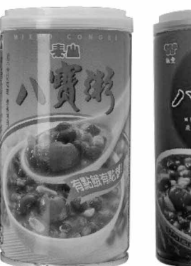
泰山 八寶粥 ¥119/375g