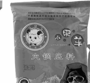
小肥羊 火鍋湯料(清湯) ¥620/110g