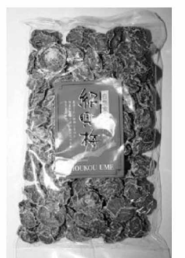
岩山 紹興梅(種あり) ¥360/200g