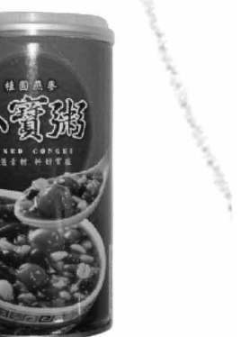
味全 桂圓燕麥八寶粥 ¥119/360g