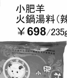
小肥羊 火鍋湯料(辣湯) ¥698/235g