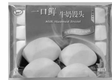
友盛一口鮮牛乳饅頭 ¥315/400g