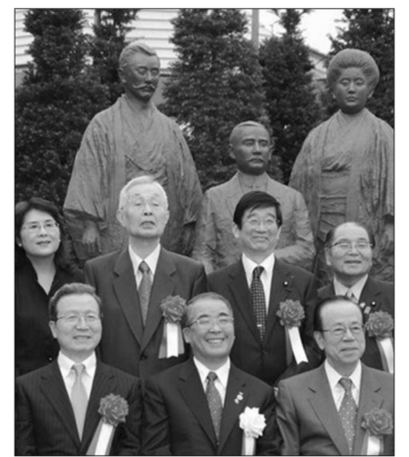
铜像体现中日两国相互帮助的历史, 以及今后中日两国的友好。揭幕仪式原计划在去年11月召开新日中友好21世纪委员会会议之际举行...