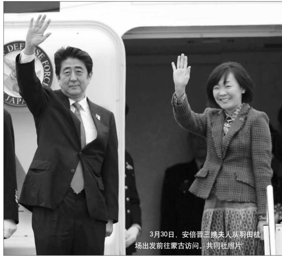
3月30日，安倍晋三携夫人从羽田机场出发前往蒙古访问。

访问蒙古时也曾提起。社科院日本研究所专家高洪指出，当时小泉给蒙古带去了一份大礼。